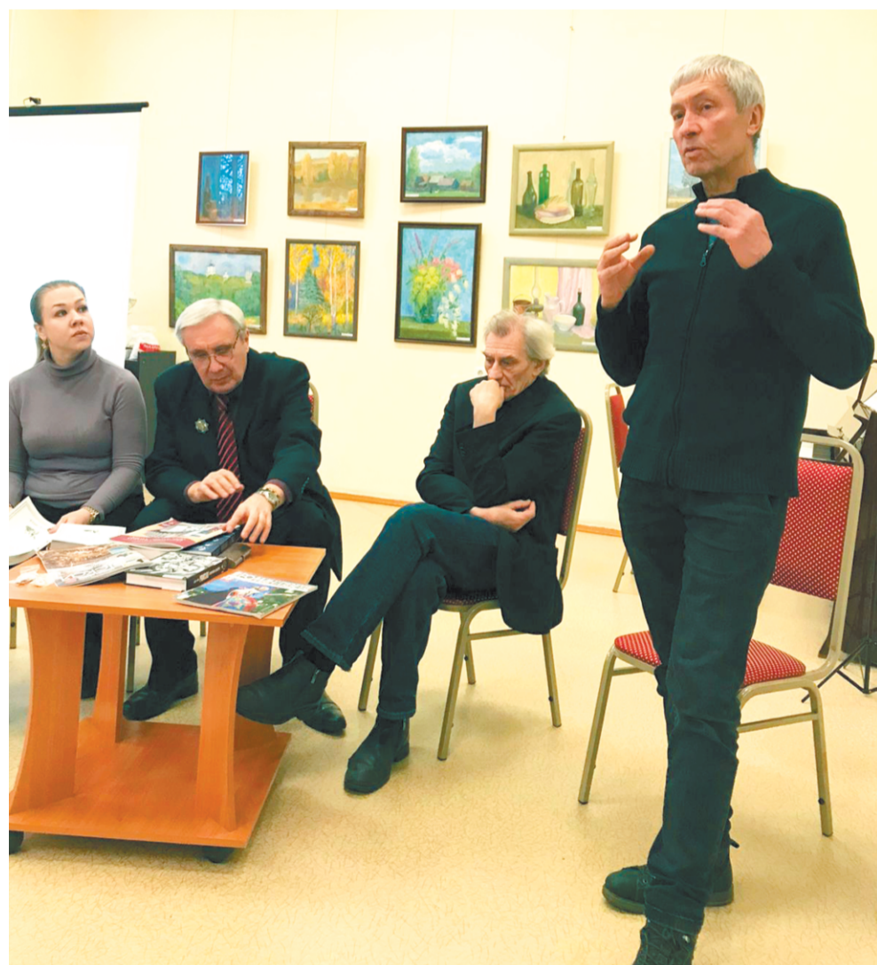
На встрече с читателями в Брянской областной научной универсальной библиотеке имени Ф.И. Тютчева

— Журнал следит за творчеством авторов, проживающих «не в столицах», и открывает читателям новые имена. На кого советуем обратить внимание?